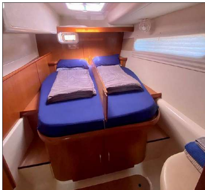
Cabine en mode couchage twin...