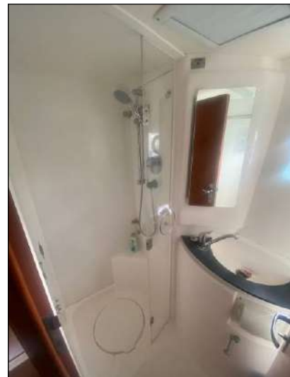
L'une des 4 cabines du bateau... et sa salle de bain...